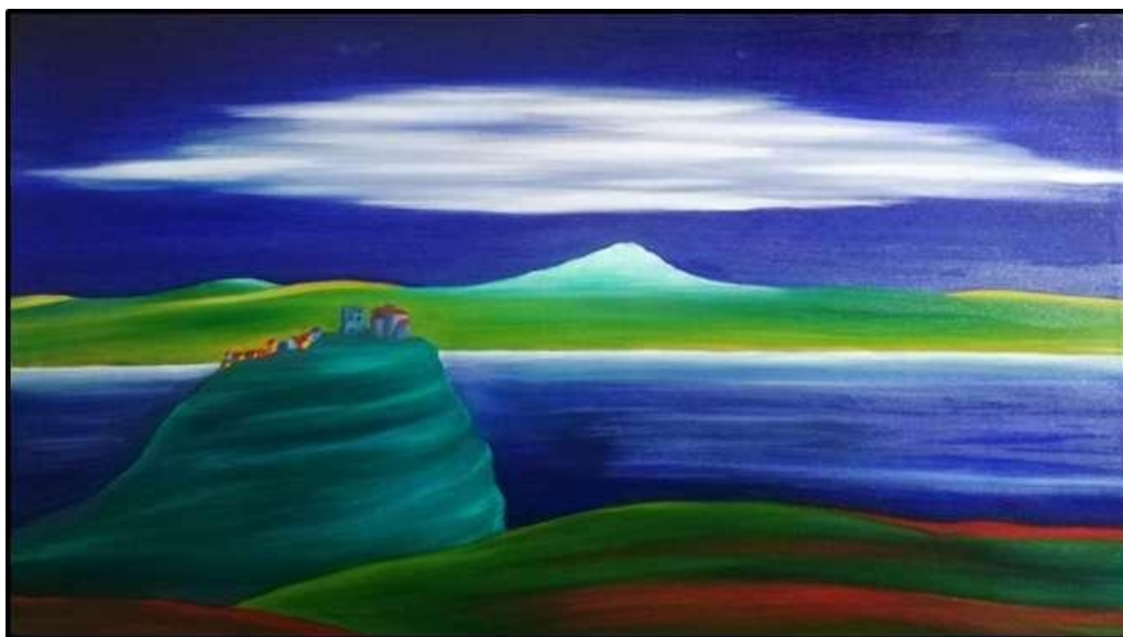
Dipinto di Giuseppe Schillaci