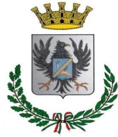
Città di Misterbianco (CT)